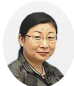
若松町こころとひふのクリニック PCIT研修センター長